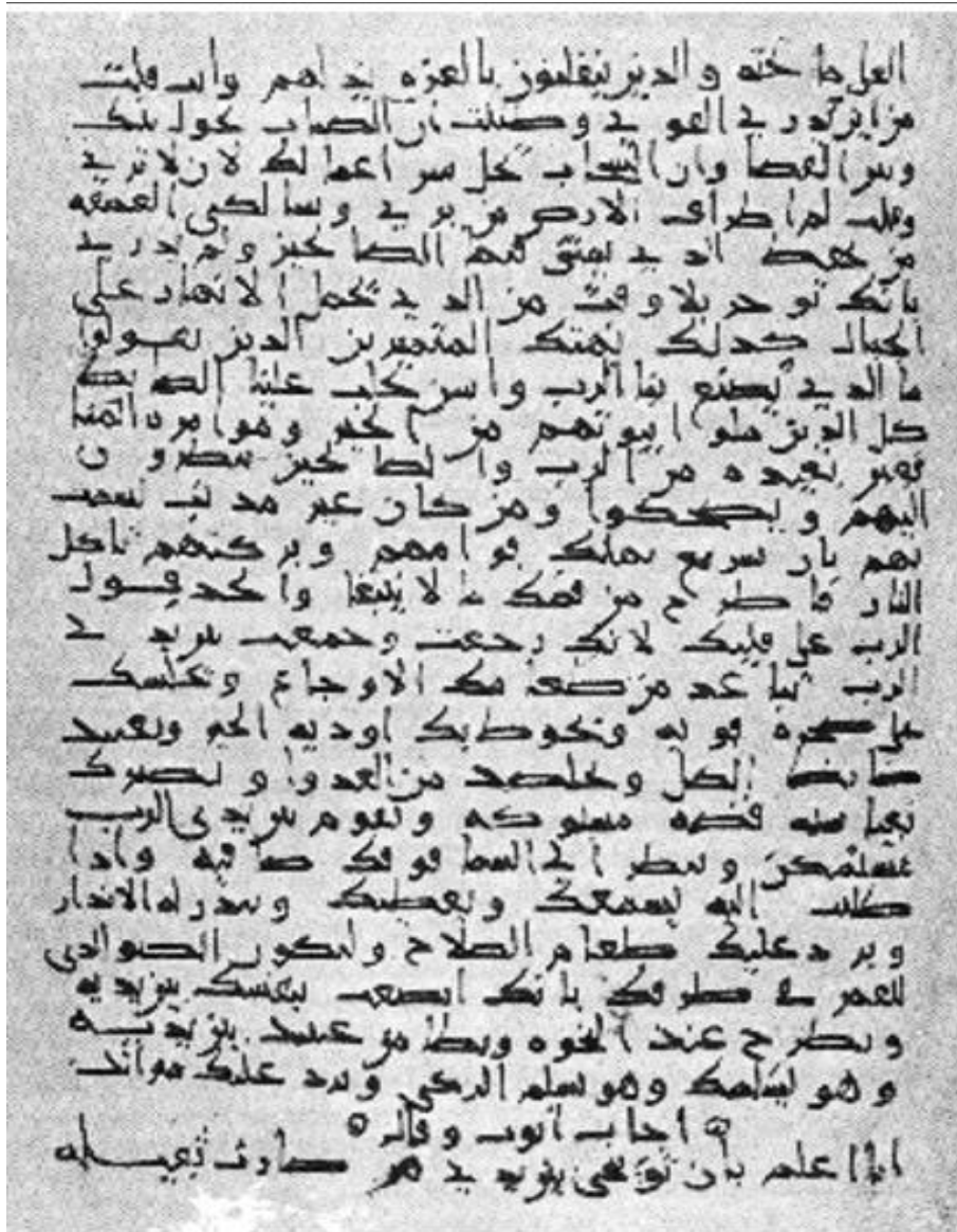
تصویری از قدیمی‌ترین نسخه عربی عهد قدیم مربوط به نیمه اول قرن نهم میلادی موجود در موزه بریتانیا به شماره ۱۴۷۵.

مسیحیان در سرزمین‌های فتح‌شده نیازمند ترجمه کتاب مقدس به عربی گشتند و پیش از آن چنین ترجمه‌ای وجود نداشته است. (Khalid al- Khazraj 1988, 1044)