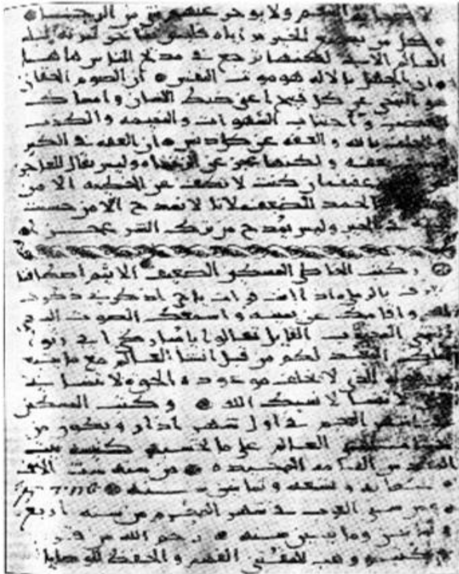
تصویری از مجموعه ۱۱۹ صفحه‌ای عربی سینا از انجیل به زبان عربی به شماره ۷۲، نوشته شده در محرم ۱۸۴ ه.ق به خط کوفی قدیم توسط استفان معروف به الرملى. ( Khalid al- Khazraj, 1939: )